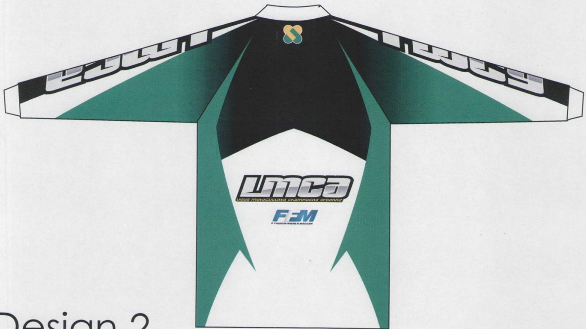
Design 2 Maillot LMCA