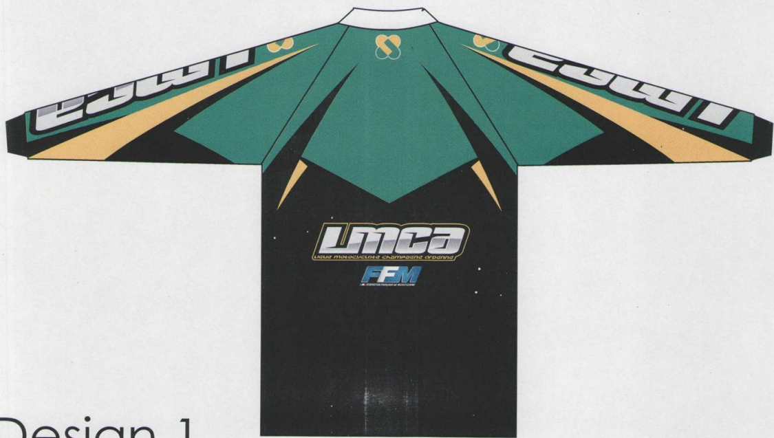
Design 1 Maillot LMCA