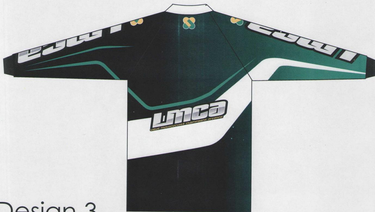
Design 3 Maillot LMCA